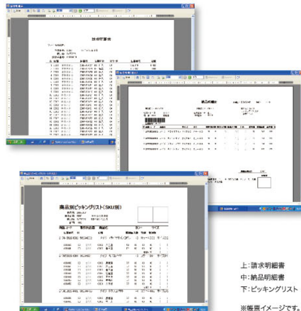
上:請求明細書 中:納品明細書 下:ピッキングリスト ※帳票イメージです。

・WinWin-EDI用ACMS Lite SEライセンス標準価格¥100,000(2008年7月現在。税、保守料は別途)。 ・支払企業/発注者の複数運用には別途オプションが必要。